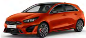
Oranžová Fusion (RNG) - pouze pro GT-line a GT