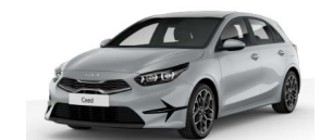
Šedá Wolf (WAF)