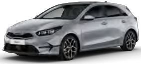
Stříbrná Sparkling (KCS)