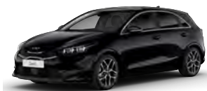
Perleťová Černá (1K)