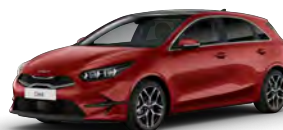
Červená Infra (AA9)