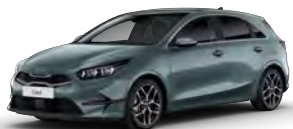
Šedá Yucca Steel (USG)