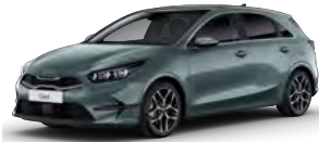
Šedá Yucca Steel (USG) - není dostupná pro GT-line a GT