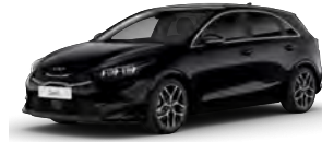
Perleťová Černá (1K)