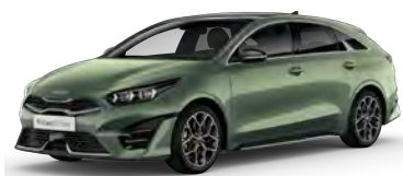
Zelená Experience (EXG)