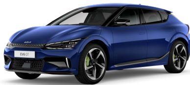
Modrá Yacht (DU3)