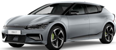
Speciální matná Šedá Mooncape (KLM)