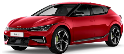
Červená Runway (CR5)