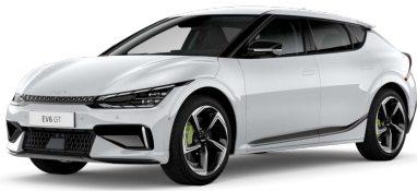
Perleťová Bílá Snow (SWP)