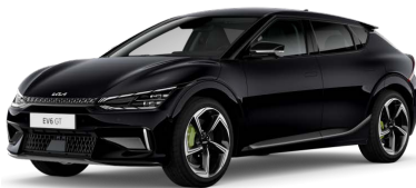
Perleťová Černá Aurora (ABP)