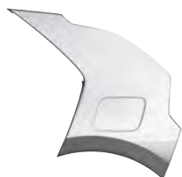
Šedá Steel (KLG)