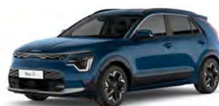
Modrá Mineral (M4B)