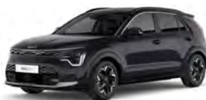
Perleťová Černá Aurora (ABP)