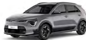
Šedá Steel (KLG)