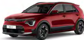
Červená Runway (CR5)