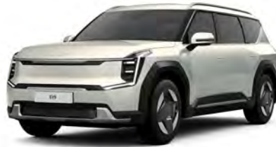
Stříbrná Ivory - matná (ISM) - nedostupné pro Air