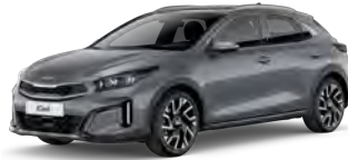
Stříbrná Lunar (CSS)