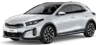
Perleťová Bílá Deluxe (HW2)